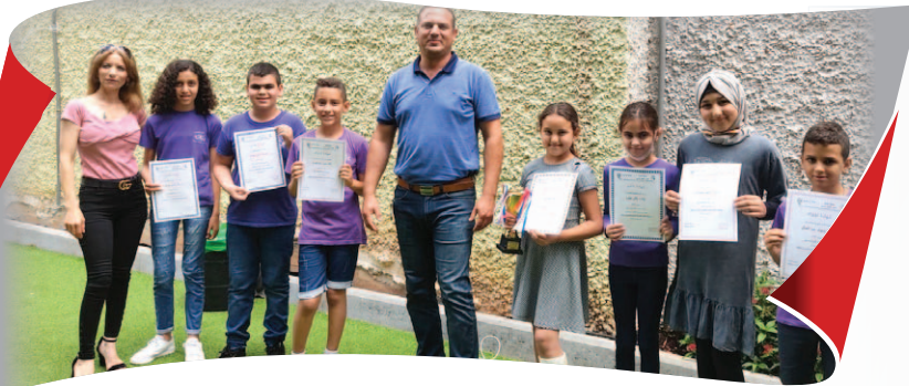
المدرسة الابتدائية - الشيخ دنون

مَتِيل قَنْدَلْفَتْ مُرَكِّزَةُ اللُّغَةِ الْعَرَبِيَّةِ فِي مَدْرَسَةِ الْمَعْمَدَانِيَّةِ - النَّاصِرَةِ