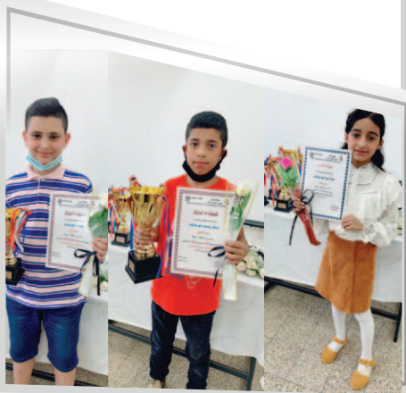
مَدْرَسَةُ الْإِخَاءِ - رَهْط