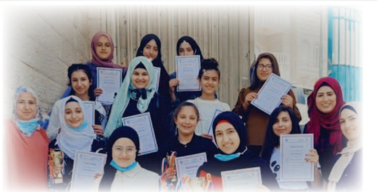
مَدْرَسَةُ السَّوَاهِرَةِ الْإِعْدَادِيَّةِ لِلبَنَاتِ - الْقُدْس