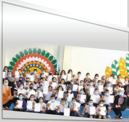
مَدْرَسَةُ الْحَكِيمِ الْإِبْتِدَائِيَّةِ - كَفْرَقَرَع