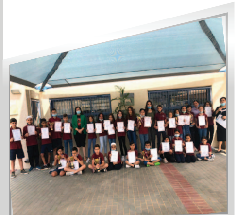
مَدْرَسَةُ الْحَدِيقَةِ ب - يَرْكَا