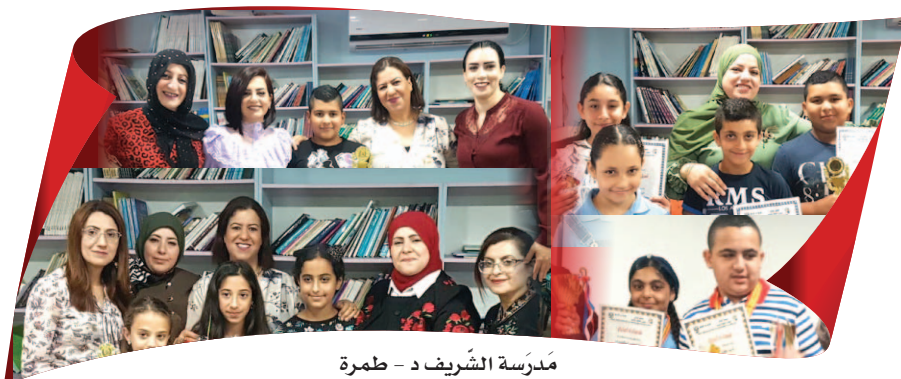
مدرسة الشريف د - طمرة