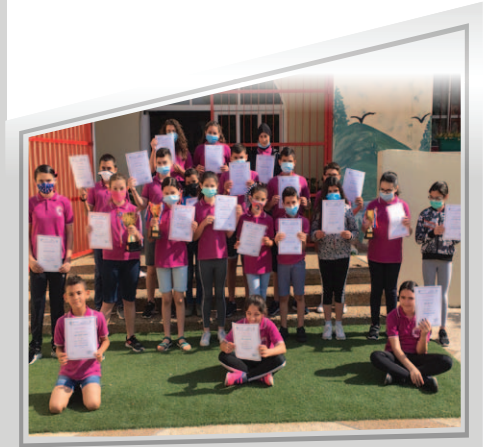
مدرسة ابن سينا - كابول