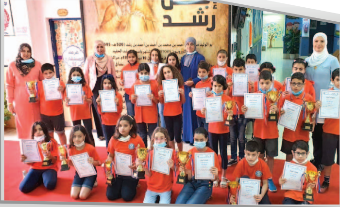
مَدْرَسَةُ ابْنِ رُشْدٍ - جَدَّة