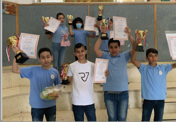
مَدْرَسَةُ النُّورِ - كَفْرَقَرَع