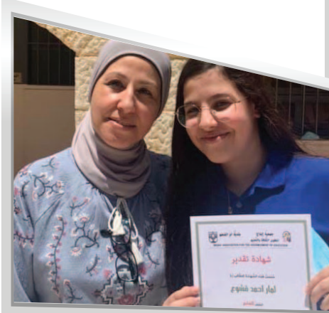
المدرسة الإعدادية ب - الطيرة