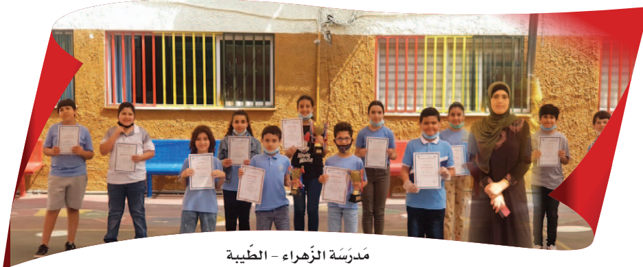
مدرسة الزهراء - الطيبة