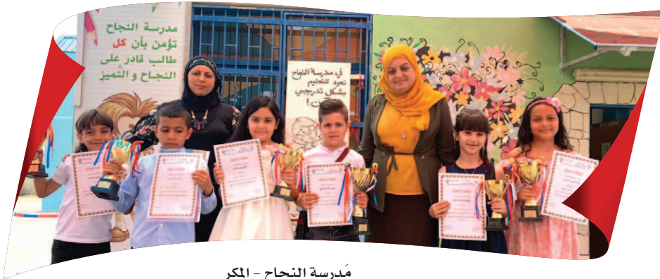
مدرسة النجاح - المكرا