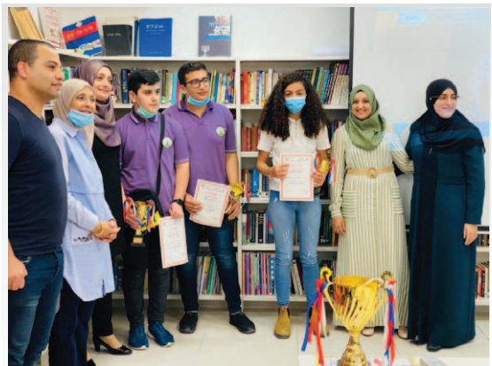
مَدْرَسَةُ الظُّهْرَاتِ الشَّامِلَةِ - الْفَرِيدِيْس