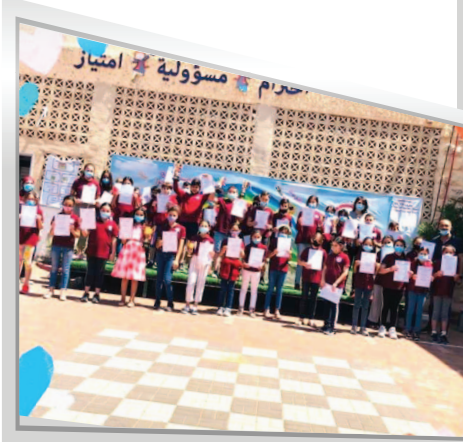
مَدْرَسَةُ الْغَزَالِي - الطَّيْرَةَ