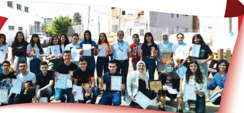
المدرسة الإعدادية - دبورية