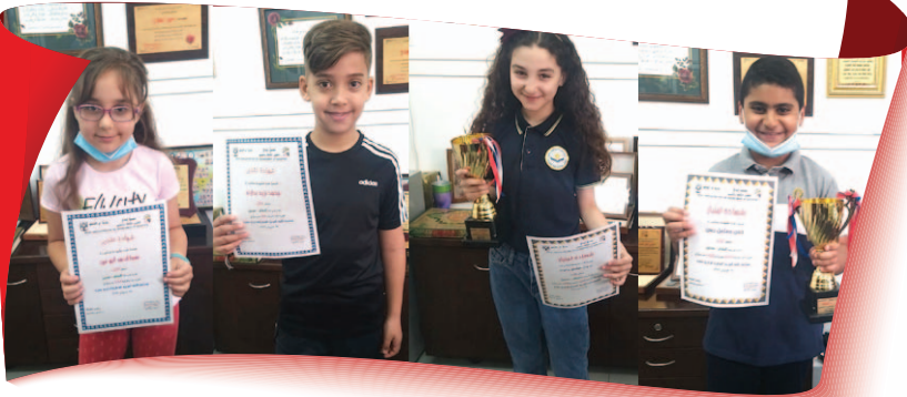
مَدْرَسَةُ الْبِشَارَاتِ الْإِبْتِدَائِيَّةِ - سَخْنِينَ