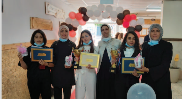
مَدْرَسَةُ وَادِي النَّسُورِ - أُمِّ الْفَحْمِ