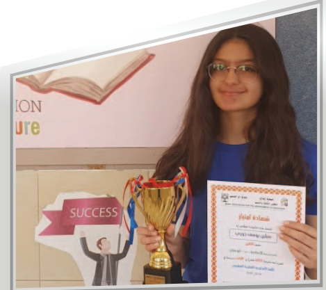
المدرسة الإعدادية ب - أبو سنان