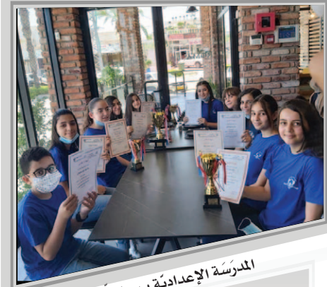
المدرسة الإعدادية ب - الطيرة