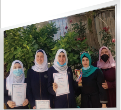
مَدْرَسَةُ الْإِيمَانِ الثَّانَوِيَّةِ لِلبَنَاتِ - الْقُدْس