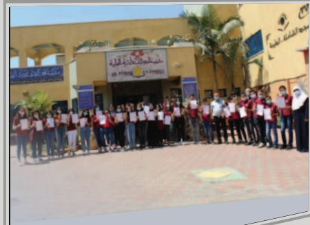
مدرسة المجد - الطيبة