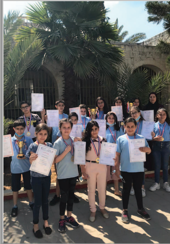
مدرسة الغزالية - الطيبة