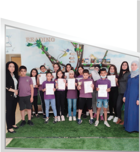
المدرسة الابتدائية - نين