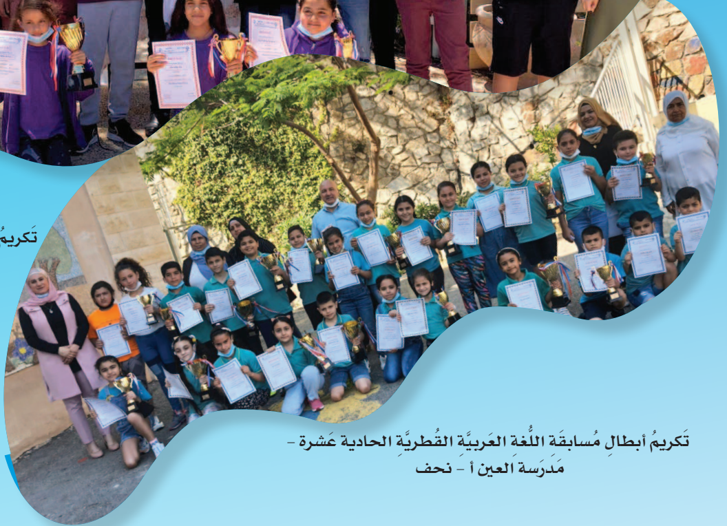
تكریم أبطال مسابقة اللُّغة العربيَّة القطريَّة الحاديَّة عشرة - مدرّسة العين أ - نحف