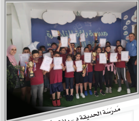
مَدْرَسَةُ الْحَدِيقَةِ د - يَاهَا النَّاصِرَة