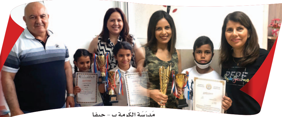
مدرسة الكرامة ب - حيفا