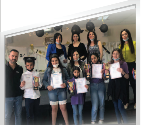
مَدْرَسَةُ الرَّازِي - النَّاصِرَة