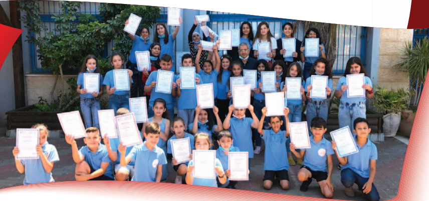
مَدْرَسَةُ الْبَيْرُونِيِّ - عَرَابَةَ