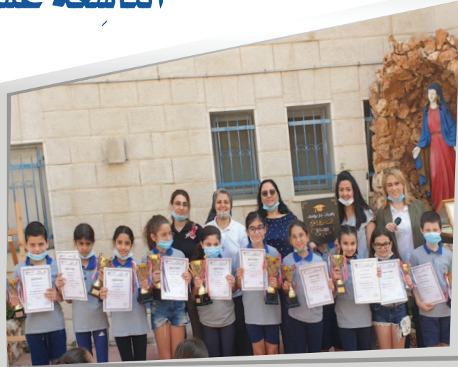
مَدْرَسَةُ رَاهِبَاتِ مَارِ يُوْسُفٍ - الرَّمْلَة