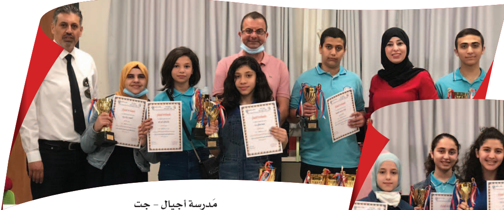
مَدْرَسَةُ أَجِيَالٍ - جَدَّة