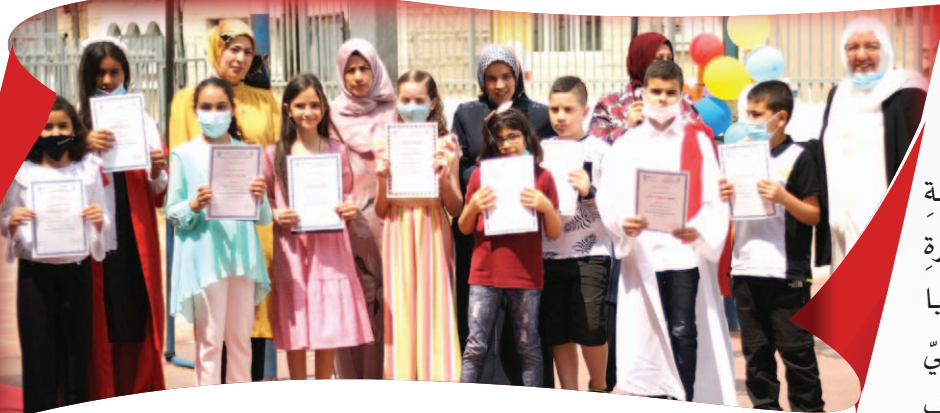
مَدْرَسَةُ الزَّهْرَاءِ - أَمِ الْفَحْمِ