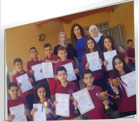
مَدْرَسَةُ العَبْهَرَة - عين ماهل