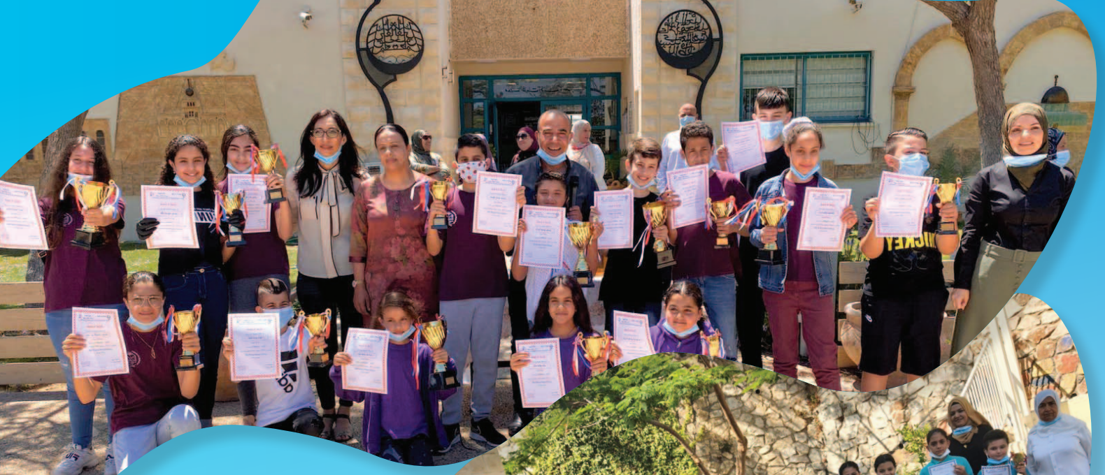
تكریم أبطال مسابقة اللُّغة الإنجليزيَّة القطريَّة العشرين - مدرّسة الظُّهرات - عرّعة