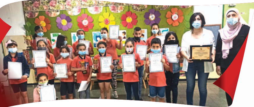
مَدْرَسَةُ الْقَلْعَةِ - النَّاصِرَةِ