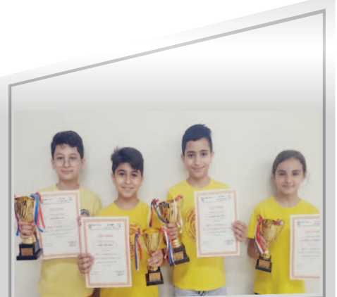
المدرسة الابتدائية ج - اكسال