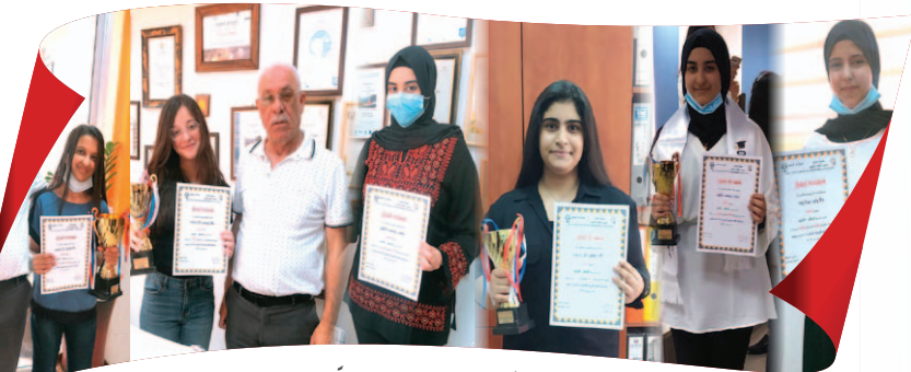
مَدْرَسَةُ السَّلَامِ - الطَّيْبِيَّةِ