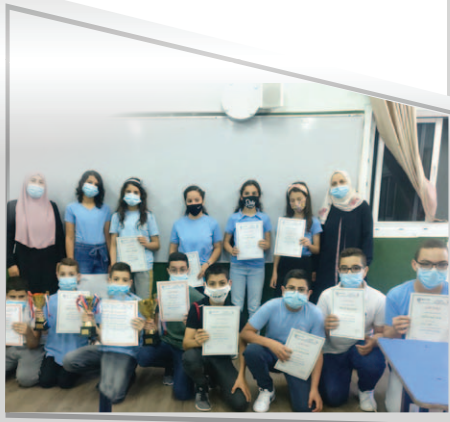
مدرسة الباطن - أم الفحم