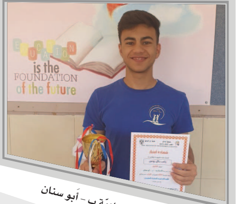
المدرسة الإعدادية ب - أبو سنان

مُسَابِقَةٌ أَكْثَرُ مِنْ رَائِعَةٍ تَمَنِّحُ الطُّلَّابَ إِثْرَاءً رَائِعًا وَتَحَفِّزُ الْمُعَلِّمِينَ وَالطُّلَّابَ عَلَى حَدِّ سَوَاءٍ. وَبِإِيْمَانِنَا الْكَبِيرِ فِي قُدْرَاتِ طُلَّابِنَا الْإِبْدَاعِيَّةِ فِي اللُّغَةِ، نُحِبُّ دَائِمًا تَشْجِيْعَهُمْ وَدَعْمَهُمْ عَلَى الْمَشَارِكَةِ فِي الْمَسَابِقَةِ، نَظْرًا لِتَنَوُّعِ الْمَهَارَاتِ التَّعْلِيمِيَّةِ الْمُخْتَلِفَةِ وَالْمَحْفَظَةِ لِلْفَهْمِ وَالْمَعْرِفَةِ، التَّلَاعُبُ بِالْكَلِمَاتِ، الثَّرْوَةُ اللُّغَوِيَّةُ وَالتَّعَرُّفُ عَلَى أَشْيَاءٍ جَدِيدَةٍ، كُلُّ ذَلِكَ يُنَمِّي الْمَطَالَعَةَ الْخَارِجِيَّةَ لَدَى الطُّلَّابِ، وَيَكْسِرُ حَاجِزَ الْخَوْفِ مِنَ الْإِحْتِبَارَاتِ الْخَارِجِيَّةِ.