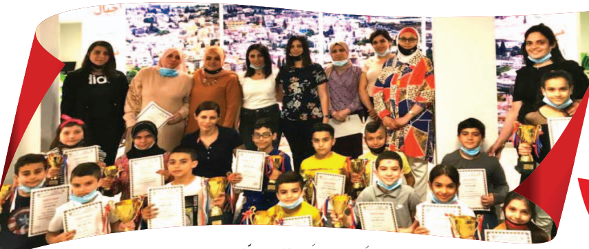
مَدْرَسَةُ الْقَصْرِ - النَّاصِرَةِ