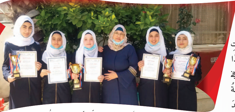
مَدْرَسَةُ الْإِيْمَانِ الثَّانَوِيَّةِ لِلْبَنَاتِ - الْقُدْسِ

الْقُدْسِ الْخَاصَّةِ النَّمُوذَجِيَّةِ - الْقُدْسِ