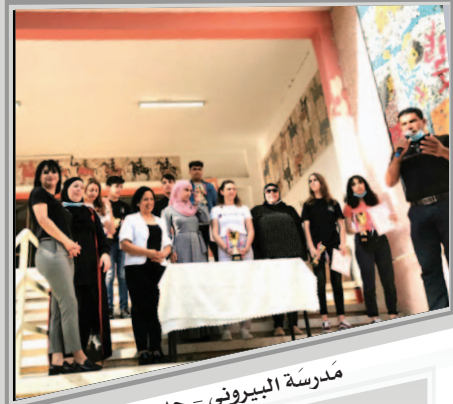
مَدْرَسَةُ الْبَيْرُونِيِّ - جَدِيدَةَ