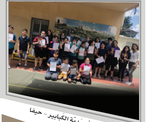
المدرسة الأحمدية الكبابير - حيفا