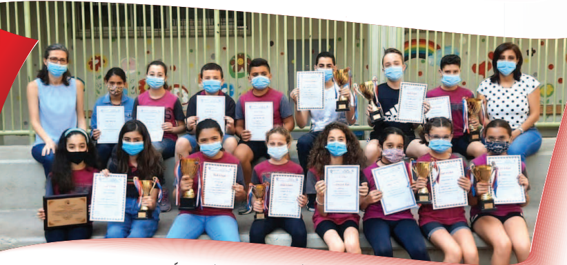
المدرسة المعمدانيّة - الناصرة