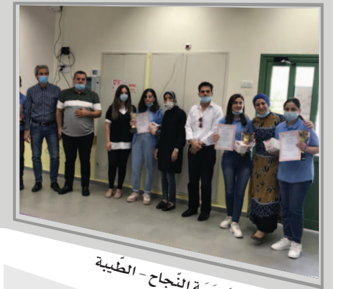
مَدْرَسَةُ النَّجَاحِ - الطَّيْرَةَ