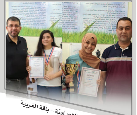
مَدْرَسَةُ ابْنِ سِينَا الْإِعْدَادِيَّة - بَاقِعَةُ الْغُرَيْبَةِ