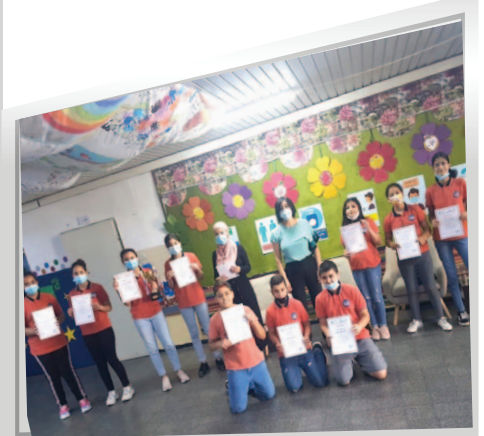
مَدْرَسَةُ الْقَلْعَةِ - النَّاصِرَةِ