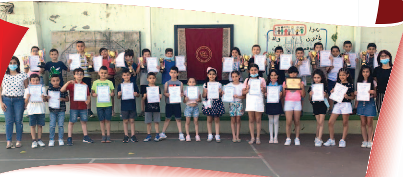
المدرسة المعمدانيّة - الناصرة