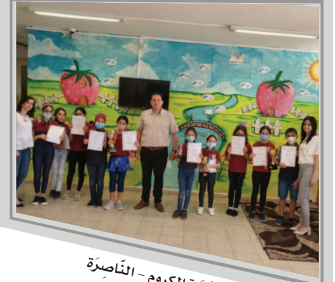
مَدْرَسَةُ الكروم - النَّاصِرَة