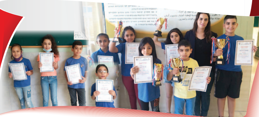
الْمَدْرَسَةُ الْإِبْتِدَائِيَّةِ ج - يَافَةَ النَّاصِرَةِ