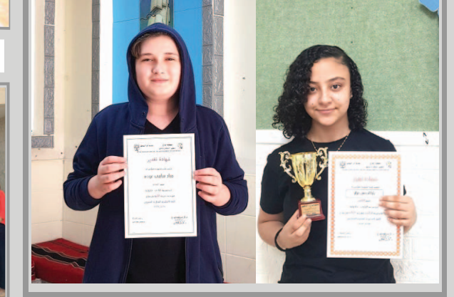
مَدْرَسَةُ الرَّازِي - جَلْجُولِيَّةِ