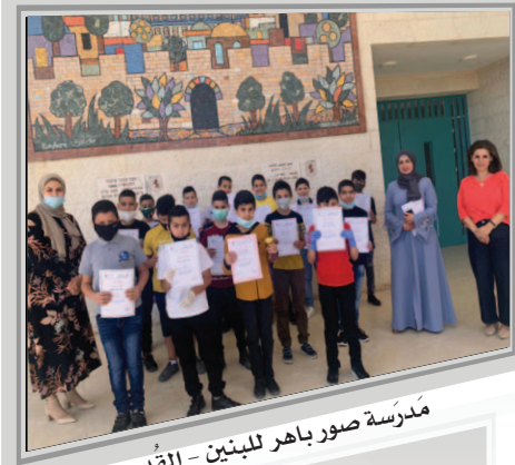
مَدْرَسَةُ صُورِ بَاهِرِ اللَّيْنِيِّنِ - الْقُدْسِ