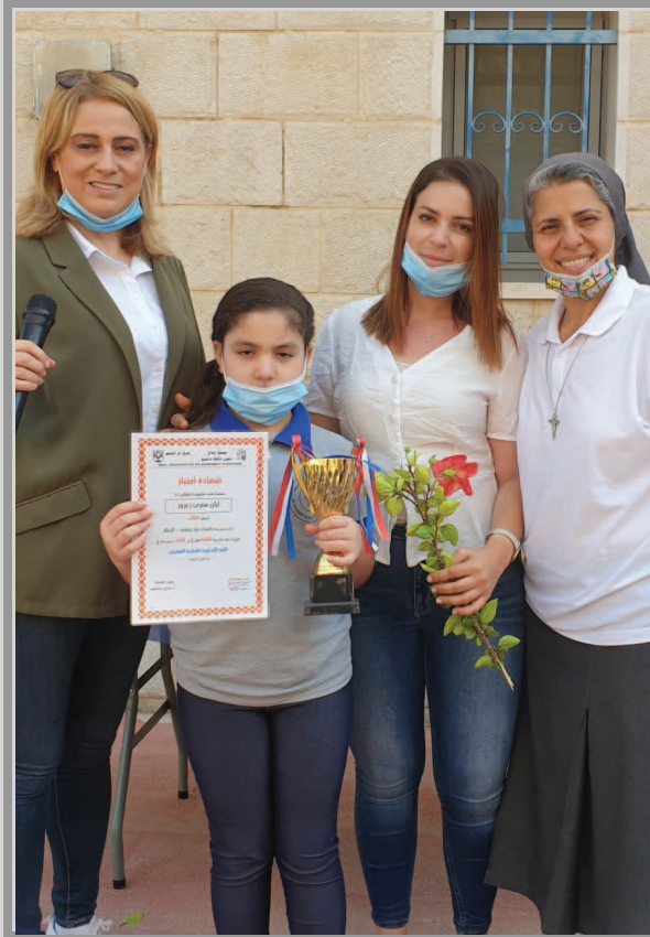
مدرسة مار يوسف - الرملة