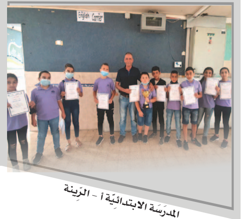
الْمَدْرَسَةُ الْإِبْتَدَائِيَّةُ أ - الرِّينَة