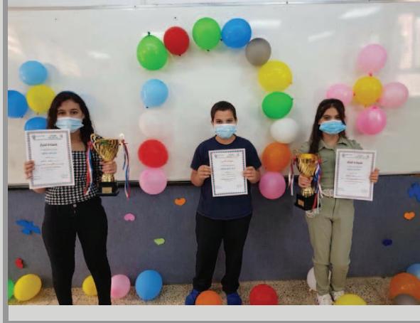
مَدْرَسَةُ الْخَيَّامِ - أَمِ الْفَحْمِ