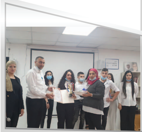
مَدْرَسَةُ وادي النُّسُور - أم الفحم