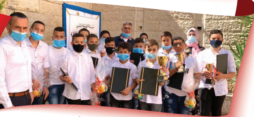
مَدْرَسَةُ الصَّلْعَةِ لِلْبَنِينَ - الْقُدْسِ