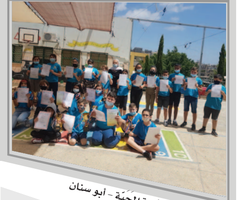
مَدْرَسَةُ الْمَحَبَّةِ - أَبُو سَنَانٍ