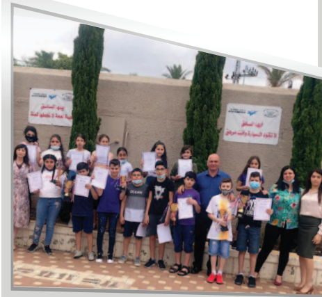
مَدْرَسَةُ التَّسَامُحِ ج - أَبُو سَنَانٍ