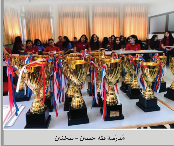
مَدْرَسَةُ طه حسين - سَخْنِين