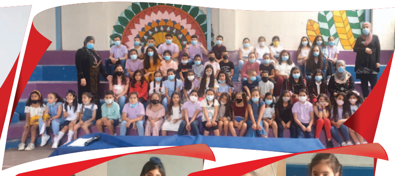
مَدْرَسَةُ الْحَكِيمِ - كَفَرِ قَرَعٍ