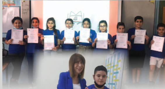
المدرسة الابتدائية ج - يافة الناصرة