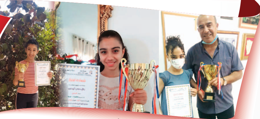
مَدْرَسَةُ الظَّهْرَاتِ - عَرَعْرَةَ

انطلاقاً من إيماننا بجمعيّتكم ونزاهتها في المحافظة على اللغة العربيّة وعلى هذا الجيل الواعد. وفي الفترة التي أصبح التعليم التقليدي مُملاً، ودخول التكنولوجيا لتغيير في جوهر اللغة العربيّة بسبب التواصل الاجتماعيّ الذي جعلنا نستخدم بالكتابة أرقاماً لتدلّ على الحروف ممّا سيؤدّي باللغة العربيّة إلى الضعف والانهيار. وجدنا أنّه لا بدّ من تغيير جذريّ للمحافظة على اللغة وصون هذا الجيل من الضياع. فوجّب علينا المشاركة بنشاطات لأمهجيّة لتطوير التفكير الإبداعيّ، فكنتم أنتم بجمعيّتكم كالنجم الساطع الذي أثار طريقنا لهذا التغيير، وساعدنا للخروج من الروتين التعليمي في المدارس، فسلطنا طريقنا خارج أسوار المدارس بدعمكم الدؤوب وجهودكم المباركة. شاركنا بمسابقة إبداع منذ نشأتها، وكنتم دوماً تشجّعوننا بإرسال كتب تدرّيبية، حيث كانت كلُّ طالبة مشاركة تدرّس الكتاب وتستفيد من المعلومات الجديدة، وتتسابق في معرفة الحلّ قبل غيرها. وبعد ذلك نقوم بمراجعة ما أجابت عنه كلُّ الطالبات مع شرح مفصّل للدروس وتوضيح أسلوب التفكير والتحليل. بهذه الطريقة نحاول إنقاذ اللغة العربيّة كما نعزز ثقة الطالبات بأنفسهنّ وقدراتهنّ المكمونة عندهن. وبها أيضاً تنمو الروح الرياضيّة في المنافسة والمشاركة وتقبّل الفوز والخسارة واضعين نصب أعيننا الاستفادة أكثر من الفوز.