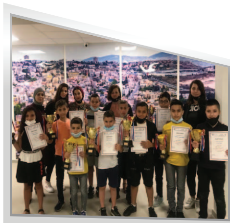
مَدْرَسَةُ الْقَسْطَلِ - النَّاصِرَةِ