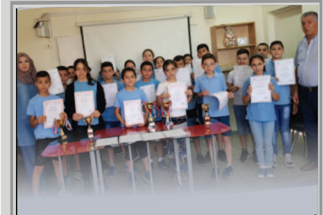
المدرسة الابتدائية أ - المشهد