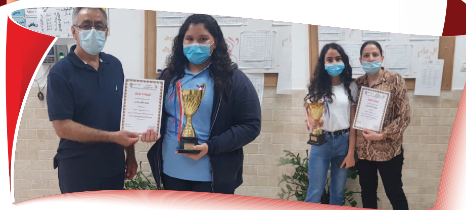
مَدْرَسَةُ ابْنِ سِينَا - كَفْرُ قَرْعٍ