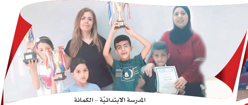
الْمَدْرَسَةُ الْاِبْتَدَائِيَّةُ - الْكَمَّانَةِ