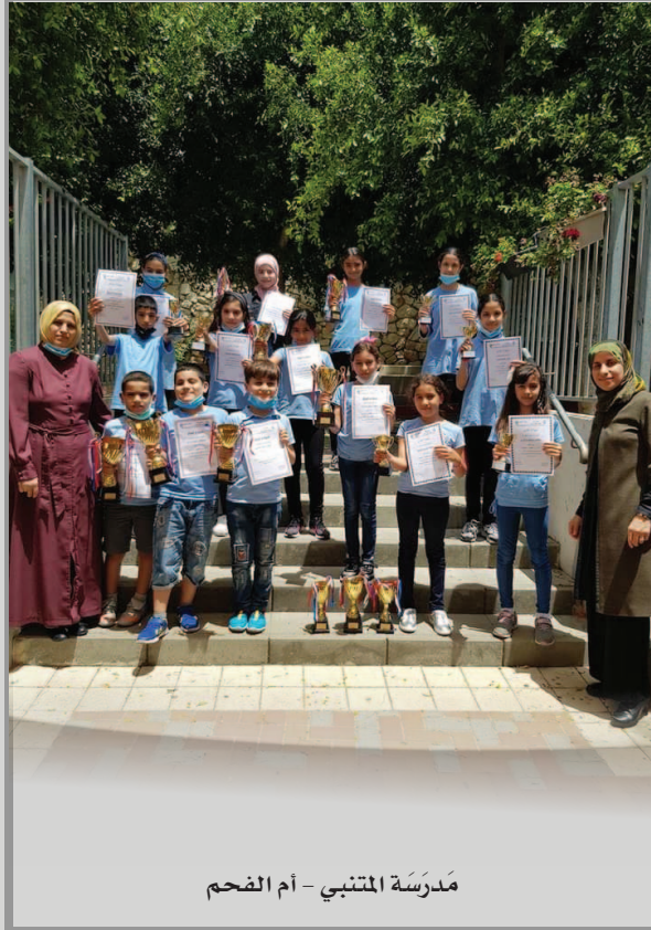
مَدْرَسَةُ الْمُتَنَبِّي - أُم الْفَحْمِ