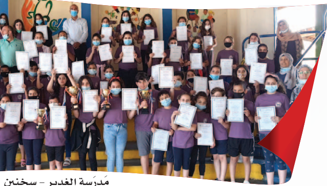
مَدْرَسَةُ الْغَدِيرِ - سَخْنِين

أَنْعَامِ سَوَاعِدِ مُرَكَّزَةِ اللُّغَةِ الْعَرَبِيَّةِ فِي مَدْرَسَةِ الْكَمَّانَةِ