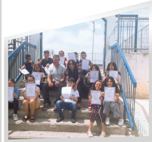
مَدْرَسَةُ الْخُرُوبِيَّةِ - شِفَاعِمَرُو