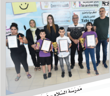
مَدْرَسَةُ السَّلَام - عَرَعْرَة